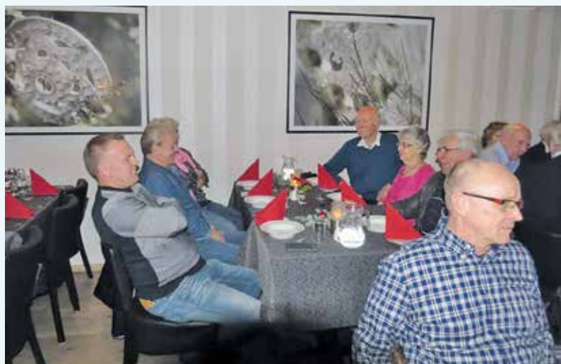
Julemøte i Setesdal