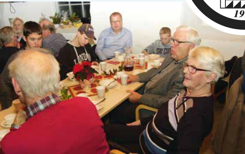
Julemøte i øst