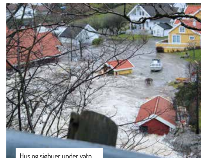
Hus og sjøbuer under vatn