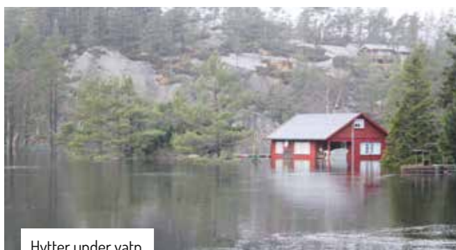
Hytter under vatn