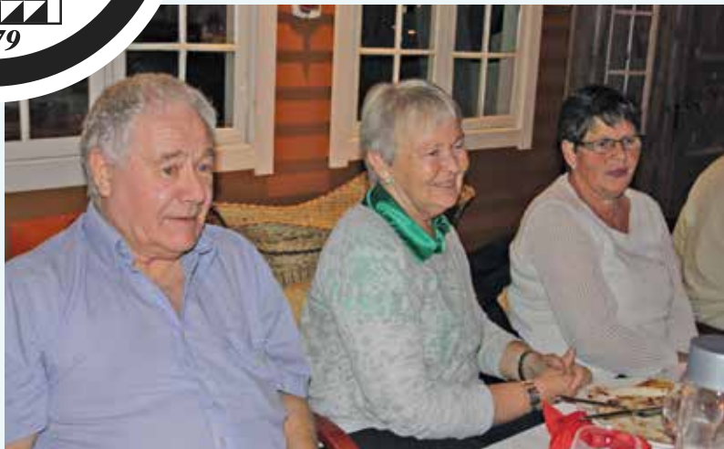
Julemøte i vest