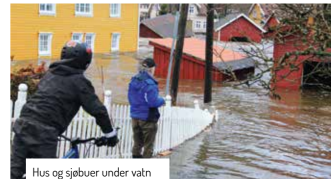
Hus og sjøbuer under vatn