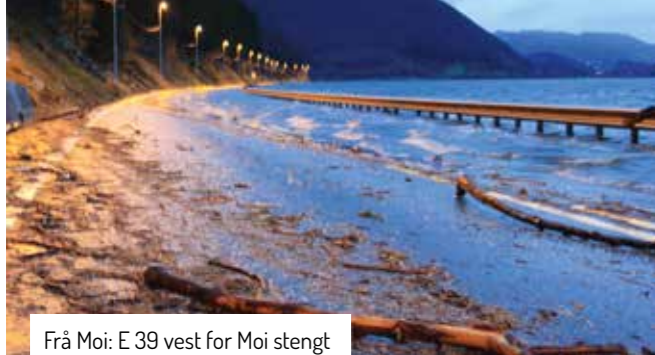
Frå Moi: E 39 vest for Moi stengt