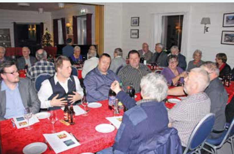
Julemøte i sentrum