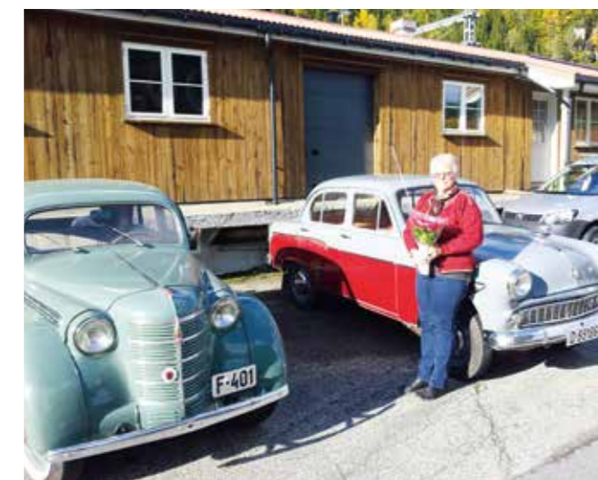
Blomster til fru.