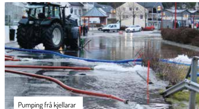
Pumping frå kjellarar