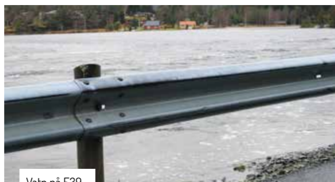
Vatn på E39