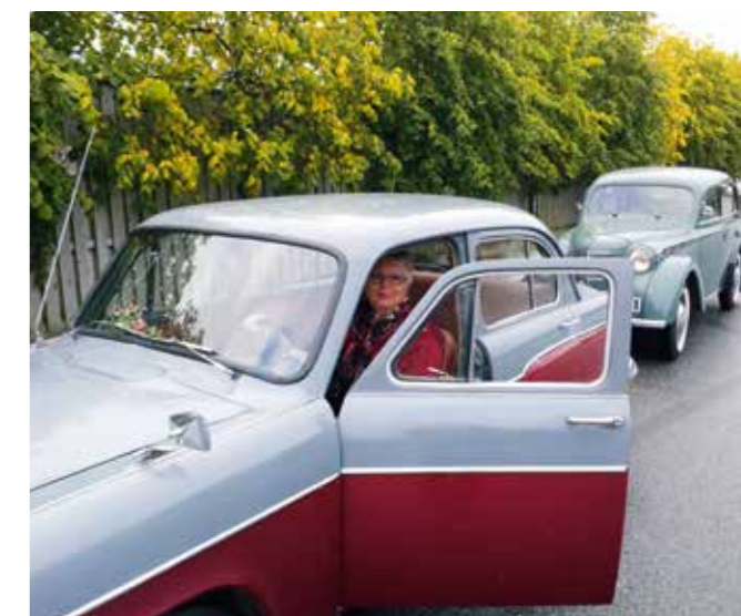
På vei til Perrongen.