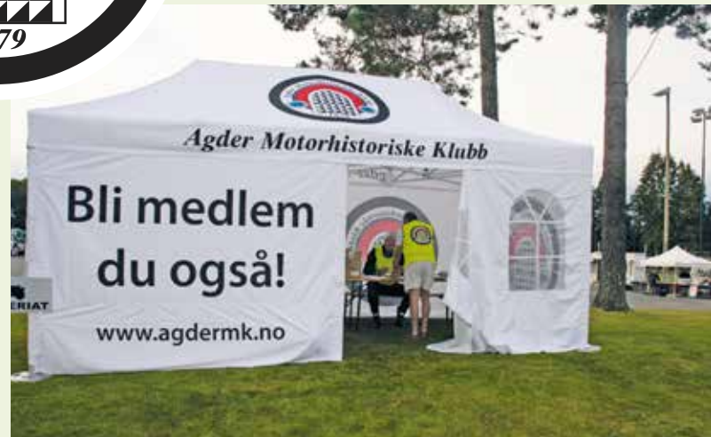
Nytt AMK telt