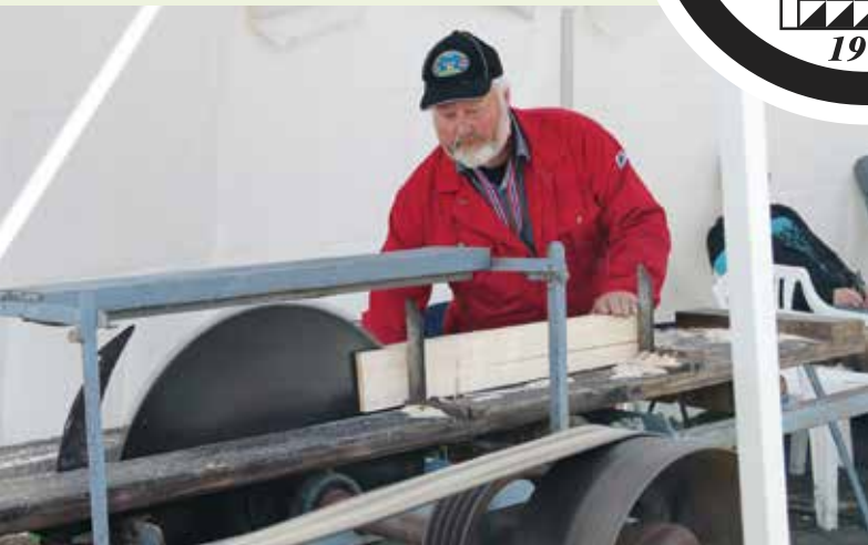
Dyrskue i Lyngdal