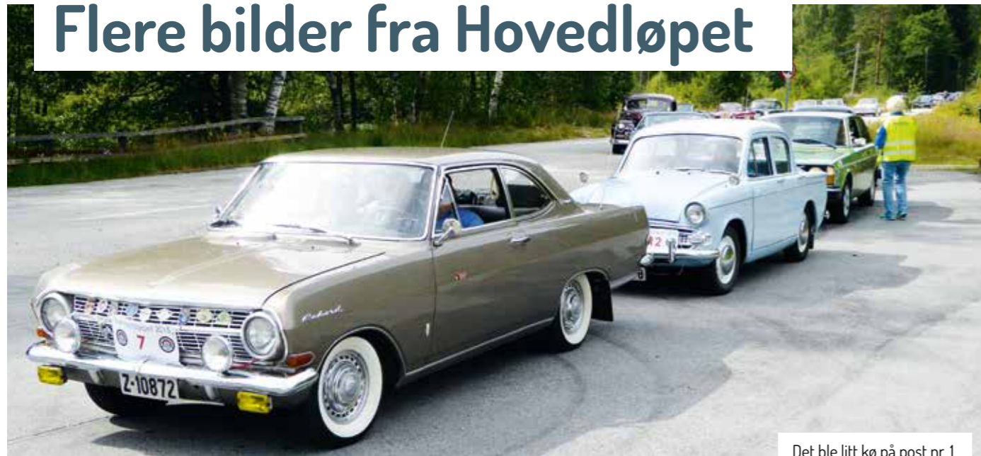
Det ble litt kø på post nr. 1