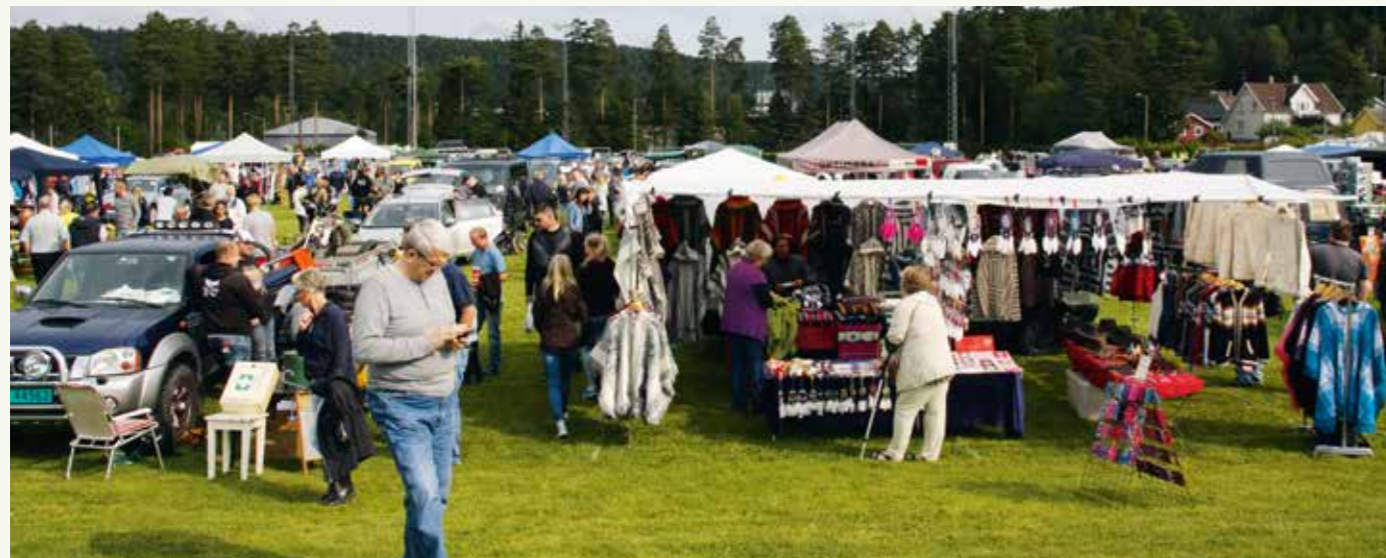
grillar, baklykter, frontlykter, mellomaksler, instrumenter, vinduer osv.

Den første dyreutstillinga fann stad i Lyngdal i 1857. Frå 1887 var det statleg dyrskue. Sidan var arrangementet ei årleg tilstelling, med livdyrauksjonar, handel, husflids-utstillinger og kulturelle innslag. Slik har det vore, og slik er det enda.