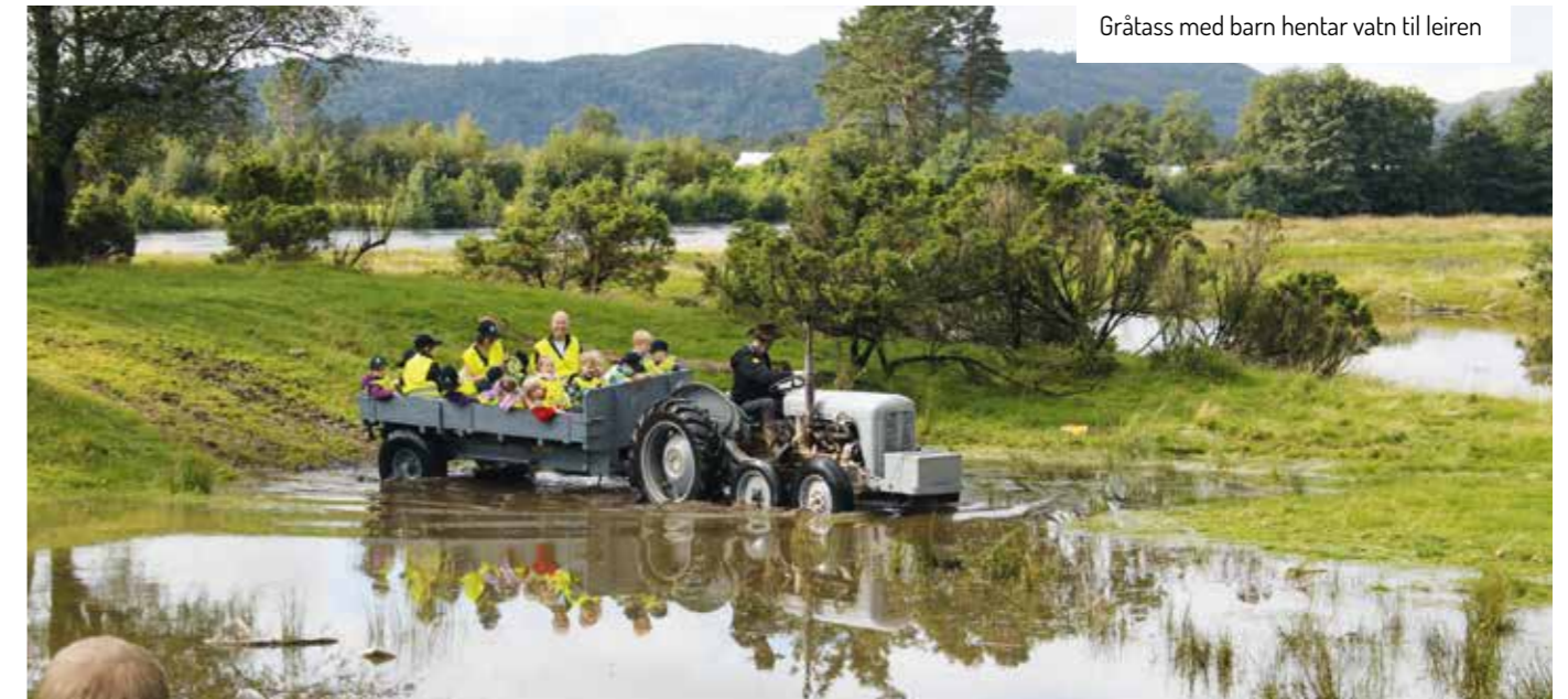
Gråtass med barn hentar vatn til leiren