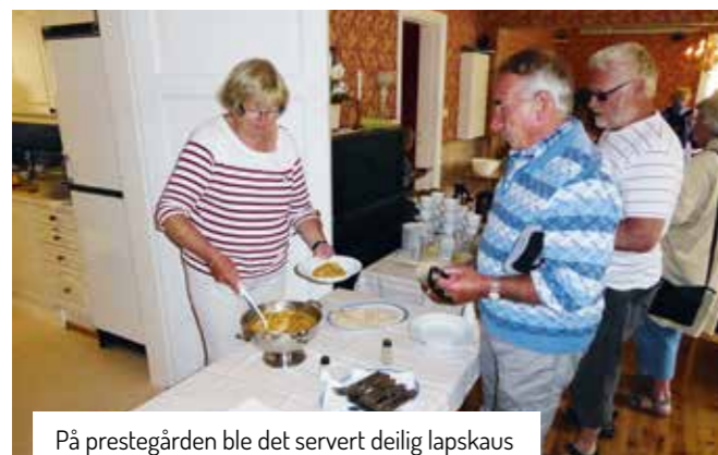
På prestegården ble det servert deilig lapskaus