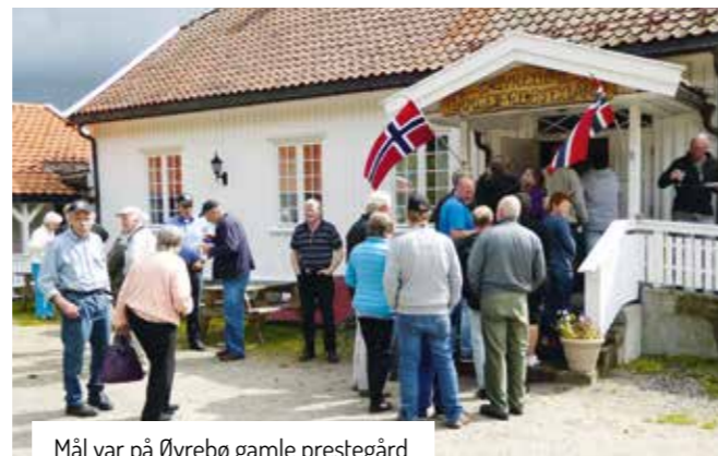
Mål var på Øvrebo gamle prestegård