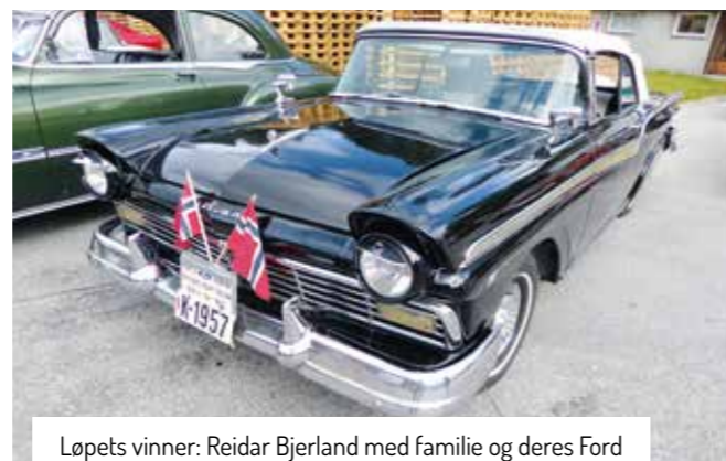
Løpets vinner: Reidar Bjerland med familie og deres Ford