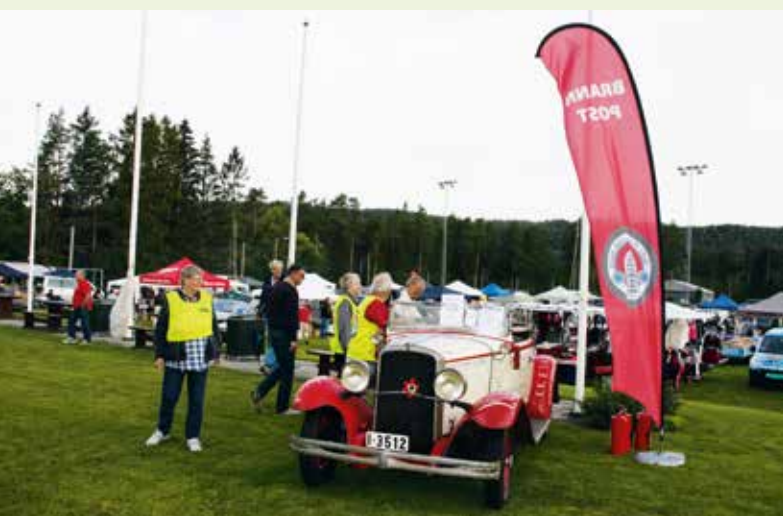
Russebil på delemarked