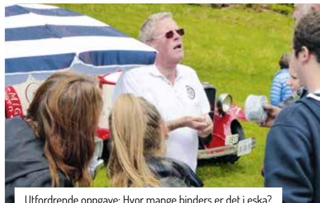
Utfordrende oppgave: Hvor mange binders er det i eska?