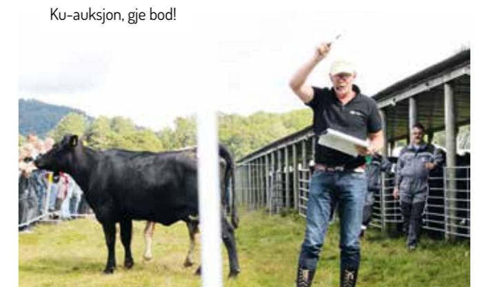
Ku-auksjon, gje bod!

Den første helga i september er det tid for dyrskue, frå fredag til søndag. Fredag er det livdyrauksjon, med rundt om 25 kyr/kviger til salgs, og interessant for mange, og mange fine dyr skiftar eigar. Lørdag er det mønstring av hest av ymse rasar, med premiering, samt riding/kjøring av hest og vogn, også dette har stor interesse for folk, og flotte dyr er å sjå.