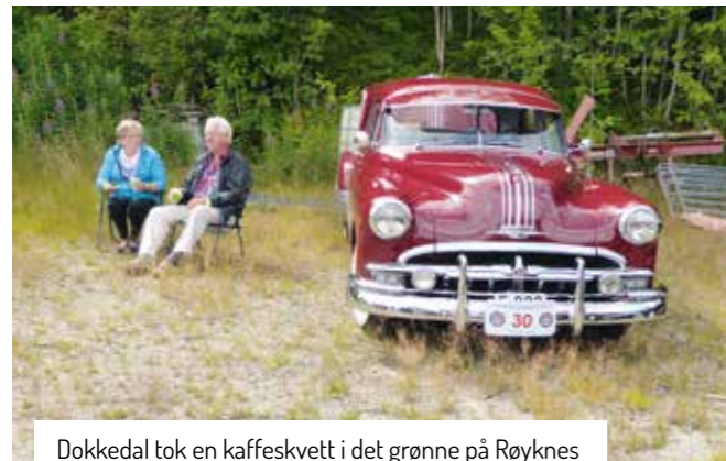
Dokkedal tok en kaffeskvett i det grønne på Røyknes