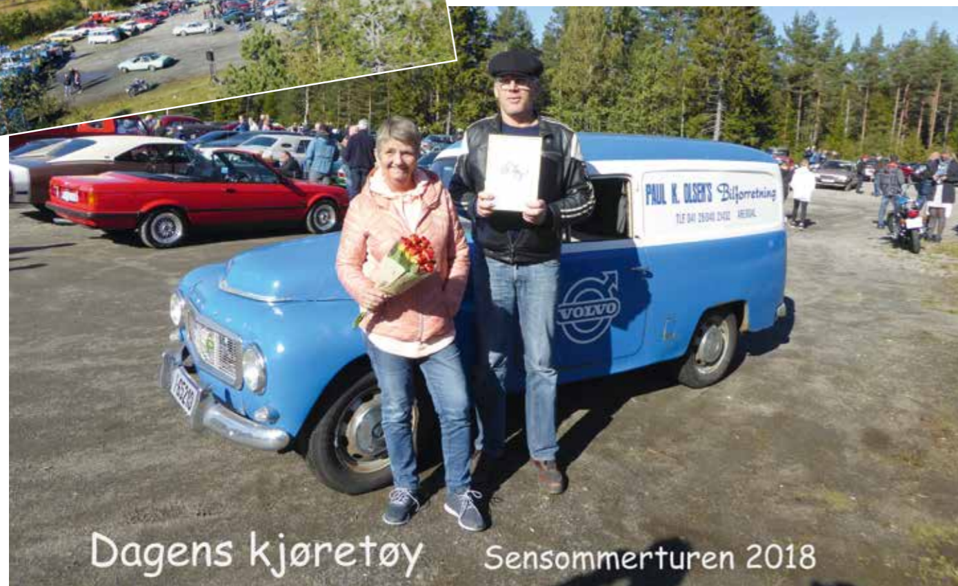
Dagens kjøretøy Sensommerturen 2018

Det ble også i år en god del kjøretøy av ymse slag, fra svære lastebiler til brannbil, Frolandsruta, en del MC er og scootere, og masse Am-Car. Mange koste seg i høstsola, og det gikk en jevn strøm av folk opp og ned trappa til Øynastua, hvor vertskapet serverte både vafler og kaffe, og pølser og lapskaus. Dette smakte godt!