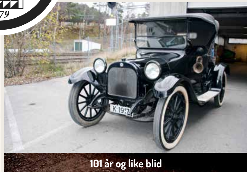
101 år og like blid