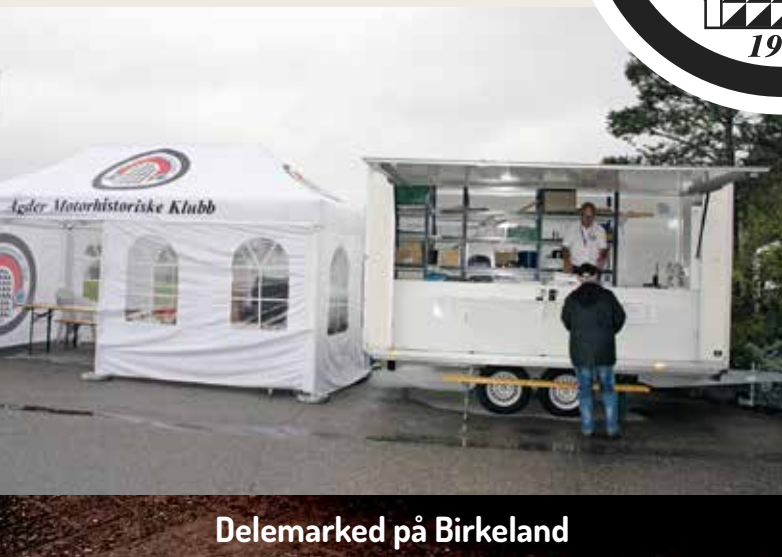
Delemarked på Birkeland