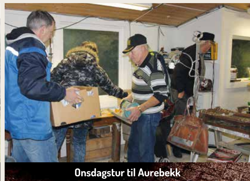
Onsdagstur til Aurebekk