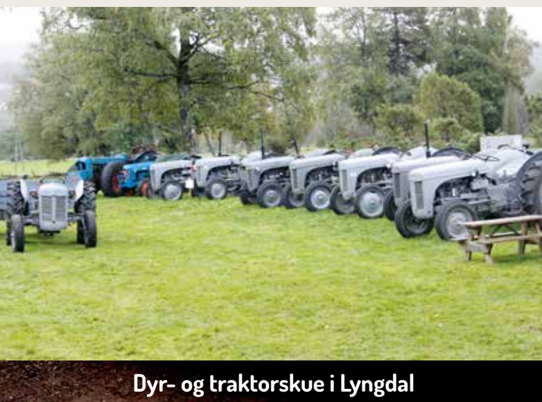
Dyr- og traktorskue i Lyngdal