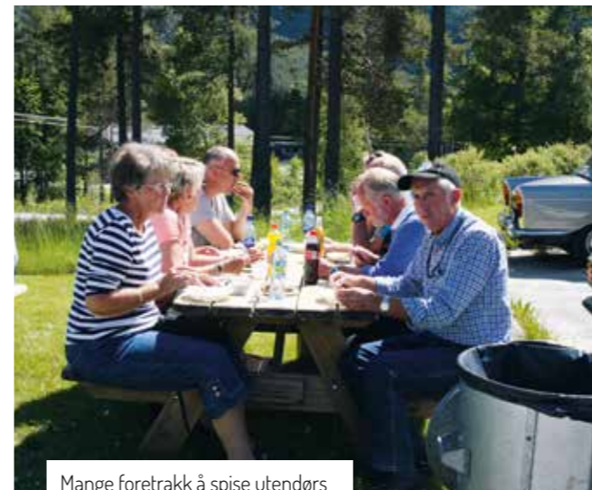
Mange foretrakk å spise utendørs