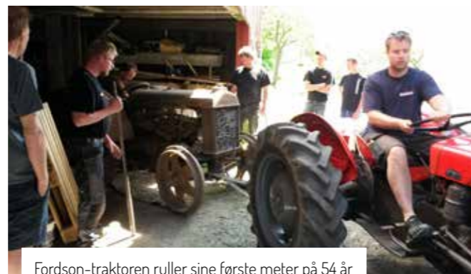
Fordson-traktoren ruller sine første meter på 54 år

Min far hadde vært flink til mange ting, men akkurat kjørekyndigheten var det vel så som så med ... Særlig hvis det var noe nøyaktig fin-kjøring så ble det gjerne til at han slurte mye på clutchen. Dette førte til at traktoren ble ganske vanskelig å ha med å gjøre. På det tidspunktet jeg overtok var den veldig vanskelig å få inn og ut av gir. Den ville ikke fri ordentlig, så det ble mye skraping og ulyd fra tennene i girkassa. Det endte med at jeg måtte ha den til reparasjon hos Albrechtsen ved Strømmen Båt og Bil. Han prøvde å bytte pluggen så den skulle gå bedre. Jeg mener å huske at det var pluggen av typen «C5» som var rette typen. Albrechtsen hadde bare «C3.» Den gikk fint i ca 10 minutter, men så var det ikke noe igjen av de pluggene. Albrechtsen måtte spesialbestille de rette pluggene, for de var vanskelige å få tak i da. «C5» pluggene var de eneste vi kunne få den til å gå ordentlig med. Så prøvde han å grave seg ned til problemet med clutchen. Det var en slags overføring til clutchen som var av bronse eller noe slags metall. Denne var helt nedslitt og tydeligvis årsaken til vanskelighetene. Albrechtsen prøvde å slaglodde på en bit med metall, slik at overføringen skulle bli lang nok igjen. Men da jeg kom