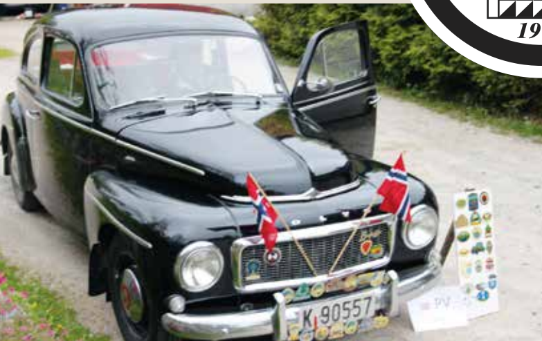
Med Volvo i 50 år