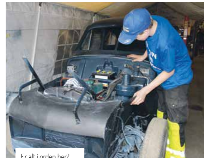
Er alt i orden her?