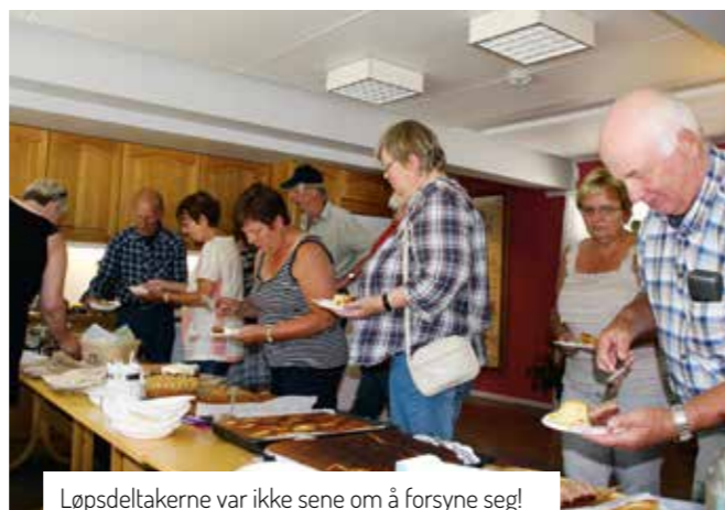
Løpsdeltakerne var ikke sene om å forsyne seg!