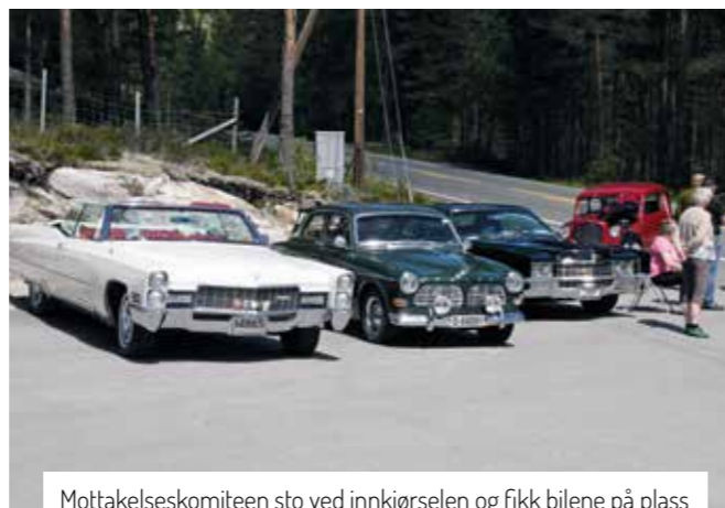
Mottakelseskomiteen sto ved innkjørselen og fikk bilene på plass