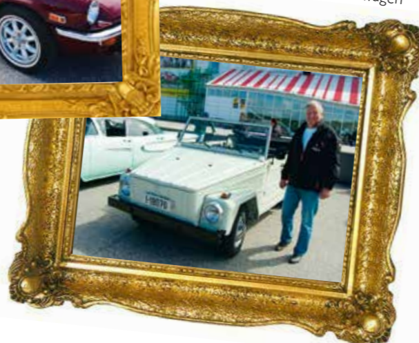
Ford Edsel og Volkswagen Kübelwagen