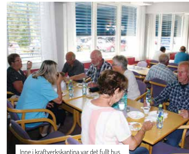
Inne i kraftverkskantina var det fullt hus