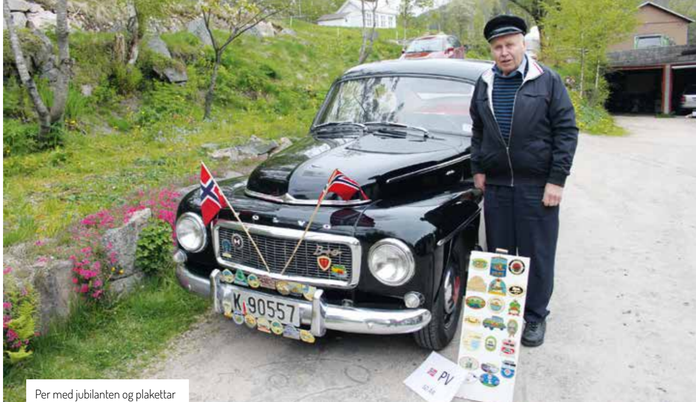
Per med jubilanten og plakettar