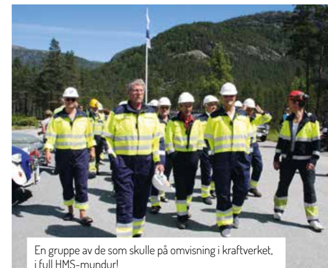
En gruppe av de som skulle på omvisning i kraftverket, i full HMS-mundur!