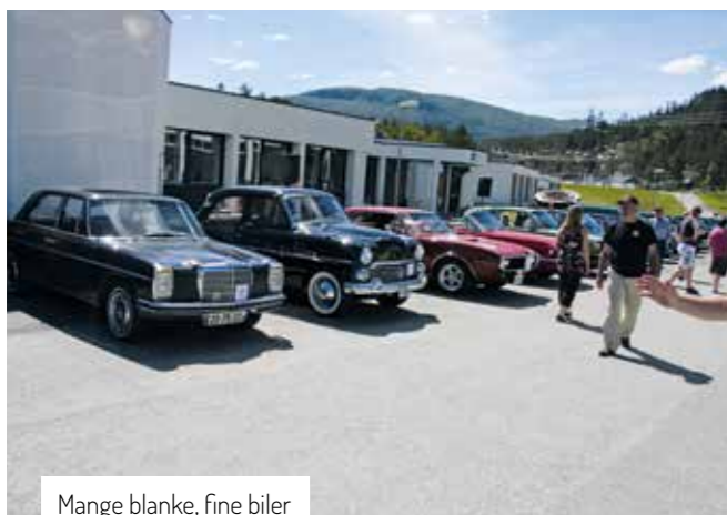
Mange blanke, fine biler