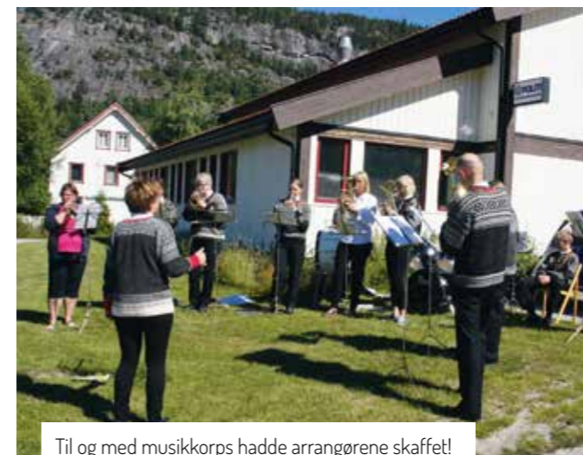
Til og med musikkorps hadde arrangørene skaffet!