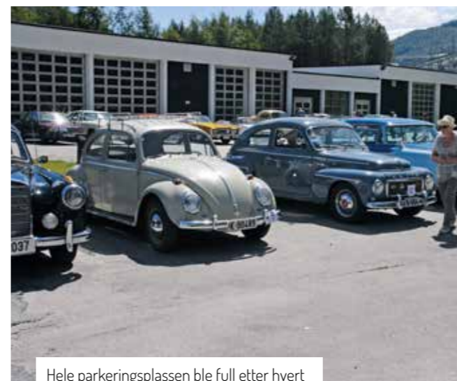
Hele parkeringsplassen ble full etter hvert