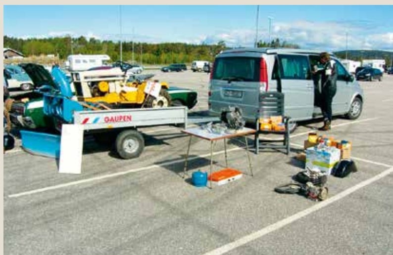
Vårmønstring med delemarked