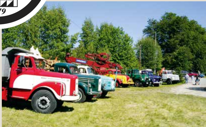
Lastebiler på Frolands Verk