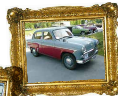
Nr. 3: Startnr. 51, Øystein Klev, Moskvitch Pilot 1962