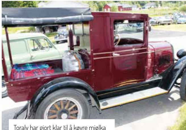
Toralv har gjort klar til å køyre mjølka