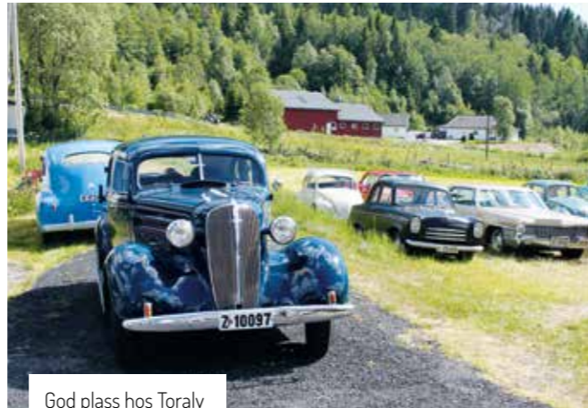
God plass hos Toralv