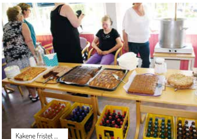
Kakene fristet ...