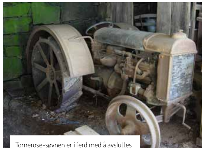
Tornerose-sønnen er i ferd med å avsluttes

Søndag 25. mai ble «en gild dag.» Det var dagen for henting av en Fordson-traktor som hadde stått stille i 54 år. Traktoren har siden den var ny tilhørt Knutsen-familien på His. Etter at den var faset ut som bruks-traktor ble den satt vekk og sto tørt og godt på samme sted i alle disse årene. Ifølge serienummeret er det en Fordson Model N fra 1931, produsert i Cork, Irland.