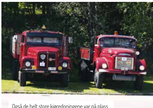
Også de helt store kjøredningene var på plass