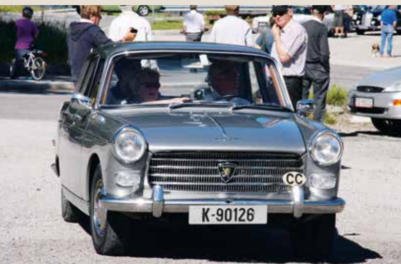
På vei til Hovedløpet