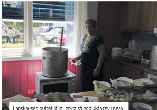
Lapskausen putret liflig i gryta så godlukta rev i nesa