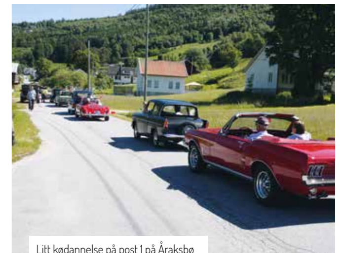
Litt kødannelse på post 1 på Åraksbø

Det var AMK's forholdsvis nystartede avdeling i Setesdal som hadde påtatt seg oppgaven med å sørge for årets hovedløp, og det klarte de med glans! Med god hjelp av avdelingens medlemmer og andre gode krefter i lokalmiljøet, som både musikkorps og 4H-avdeling, ble løpet gjennomført på en prikkfri måte.