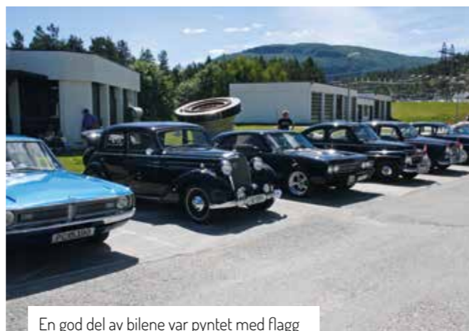
En god del av bilene var pyntet med flagg