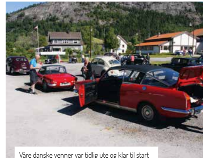
Våre danske venner var tidlig ute og klar til start