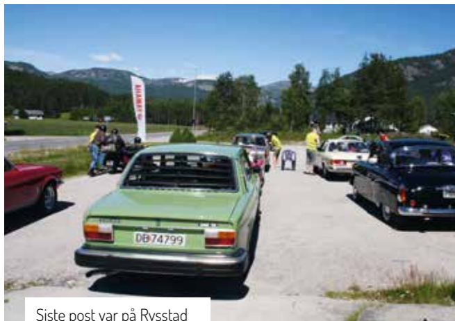
Siste post var på Rysstad