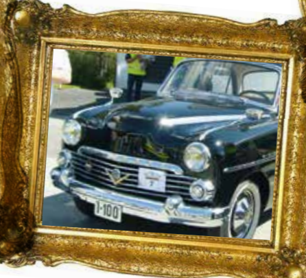
Nr. 2: Startnr. 7, Øyvind Eikelia, Vauxhall Velox 1957